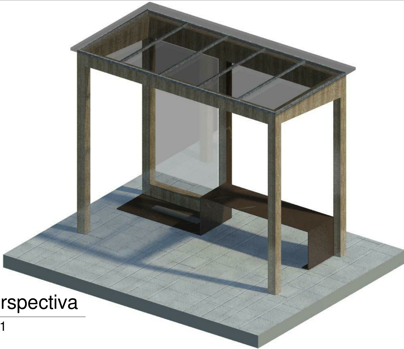
2 Perspectiva 1 : 1